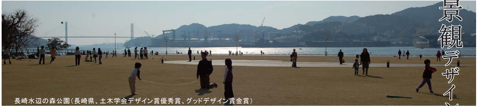
長崎水辺の森公園(長崎県、土木学会デザイン賞優秀賞、グッドデザイン賞金賞)