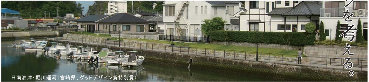
日南油津・堀川運河(宮崎県、グッドデザイン賞特別賞)

※写真の4事例は、篠原氏が九州において設計指導・監修された構造物・空間の一例です。