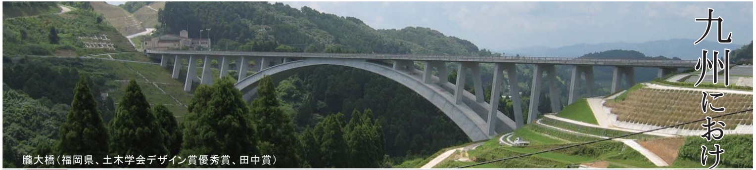
朧大橋(福岡県、土木学会デザイン賞優秀賞、田中賞)